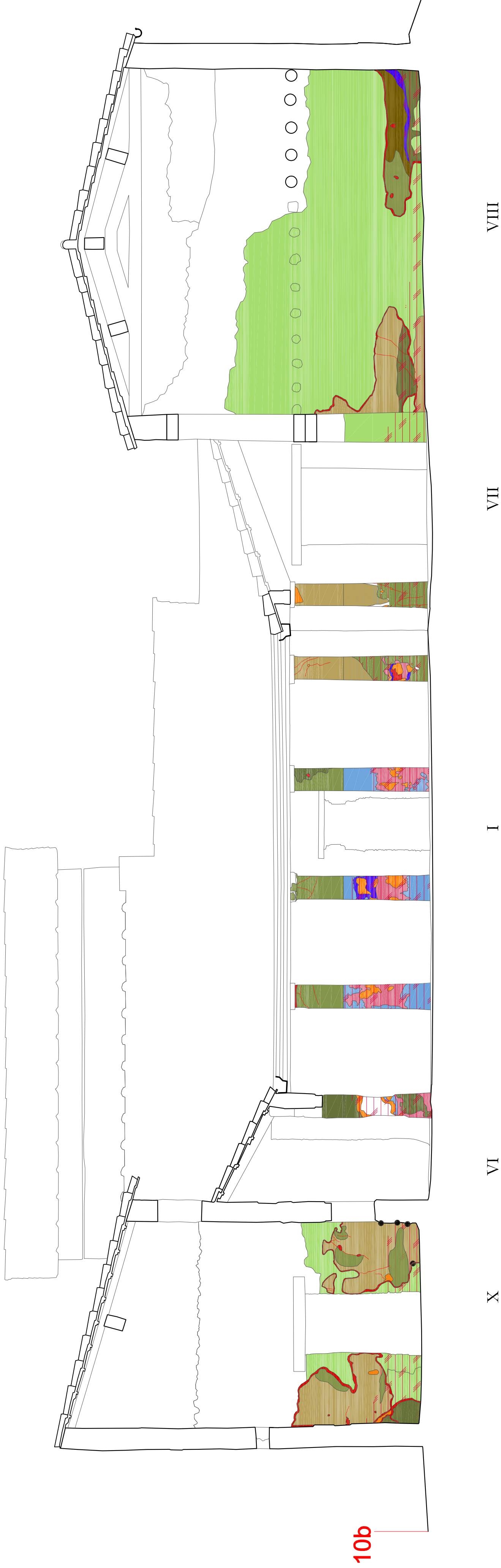
SEZIONE 10b scala 1:50