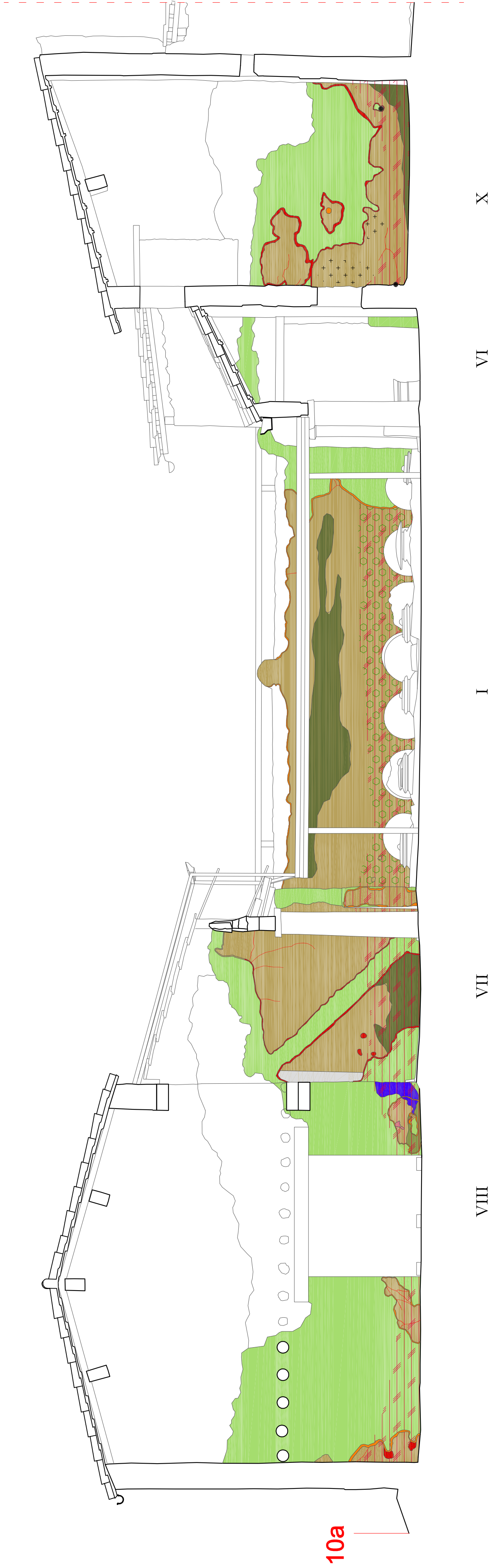
SEZIONE 10a scala 1:50